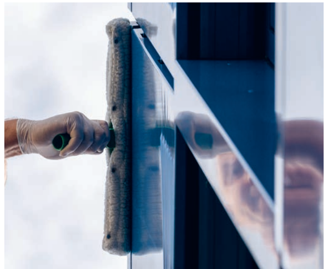
Versiegelung der Aluminiumfassade