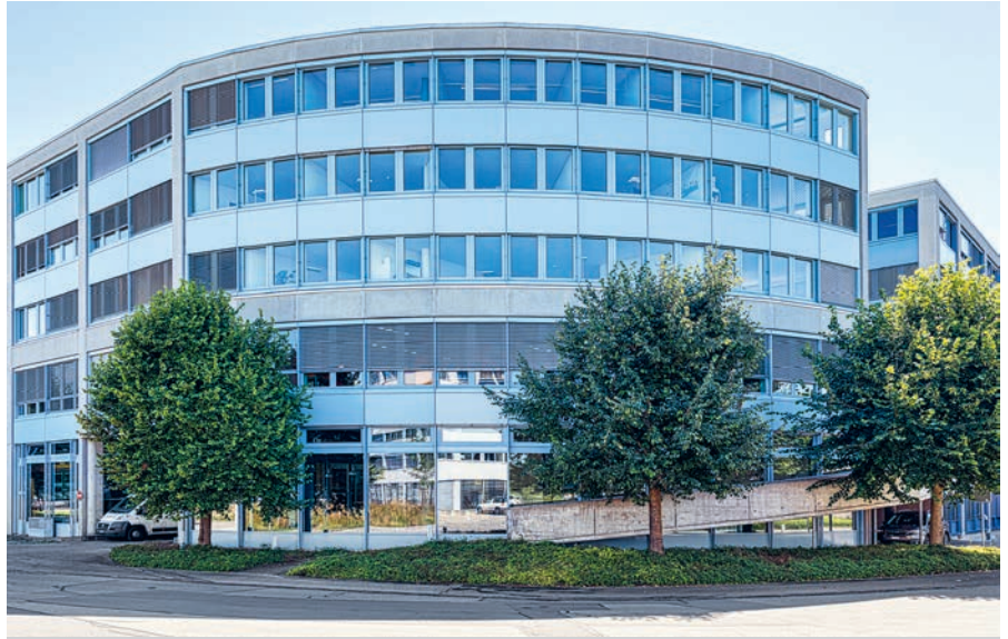
Dank professioneller Grundreinigung und Schutzbehandlung erstrahlt die Fassade wieder in frischem Glanz.

Als SZFF-zertifizierter Reinigungsbetrieb weiss Pronto genau, wie sich verwitterte Aluminiumfassaden wieder in Form bringen lassen und welche Reinigungs- und Hilfsmittel zum Einsatz kommen müssen. Am Anfang der Arbeiten am Gebäudekomplex standen eine genaue Sichtung und Analyse der Fassade sowie eine Probereinigung. Dabei wurde auch klar, dass die einzelnen Gebäude tatsächlich farblich leicht abgestuft sind und die Unterschiede nicht etwa auf einen unterschiedlich starken Auskreidungszustand zurückzuführen waren. Durch die Grundreinigung und Versiegelung konnten die Farbtonunterschiede wieder ins rechte Licht gerückt und die Wirkung der gesamten Fassade optimiert werden.